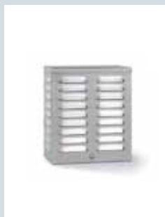
Akustische Kompakt-Signalgebereinheit ES 12 K

100059812 RAL 9016 verkehrsweiß, Zinkor-Stahlblech 100059831 RAL 9016 verkehrsweiß, Alu-Blech 100059836 Edelstahl Optik, Edelstahl V2A VdS-Klasse C (G 190001)