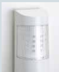
OAS-K weiß mit klarer Linse VdS-Kl. C G 106056 Art.-Nr. 100059531