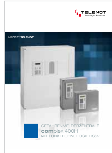
Prospekt „complex 400H“