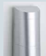
AS silber VdS-Kl. C G 106055 Art.-Nr. 400059540

Nachrüstset für – Mastmontage 400059595 – Eckmontage 400059590