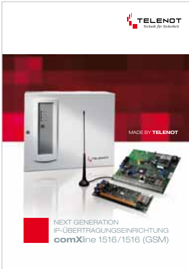
Prospekt „comXline 1516/1516 (GSM)“