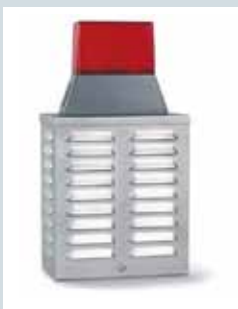
Akustisch-/Optische Kompakt-Signalgebereinheit ES 12 K/FBL 12

100059812 RAL 9016 verkehrsweiß, Zinkor-Stahlblech 100059831 RAL 9016 verkehrsweiß, Alu-Blech 100059836 Edelstahl Optik, Edelstahl V2A VdS-Klasse C (G 190001)