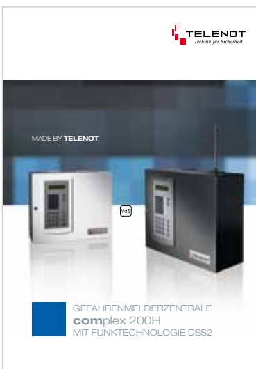
Prospekt „complex 200H“