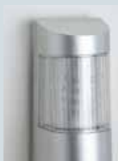
OAS-K silber mit klarer Linse VdS-Kl. C G 106056 Art.-Nr. 400059531

Nachrüstset für – Mastmontage 400059595 – Eckmontage 400059590