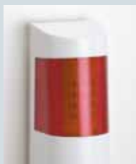
OAS-R weiß mit roter Linse VdS-Kl. C G 106056 Art.-Nr. 100059530