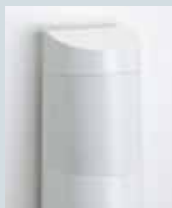
AS weiß VdS-Kl. C G 106055 Art.-Nr. 100059540

Nachrüstset für – Mastmontage 400059595 – Eckmontage 400059590